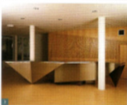
1 - Coupe-dévation, 2 - Vue latérale, 3 - Vue d'ensemble.